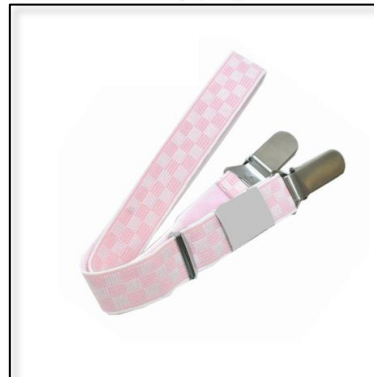
コーリンベルト(2本)