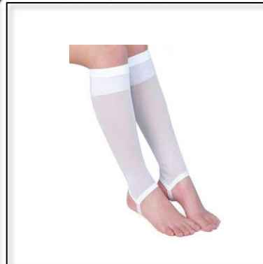
和装用ストッキング