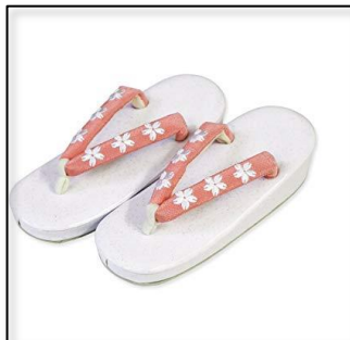
草履 (屋内・屋外用)