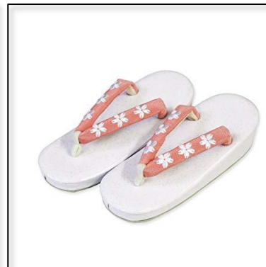
草履 (屋内・屋外用)