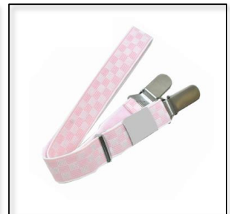
コーリンベルト(2本)