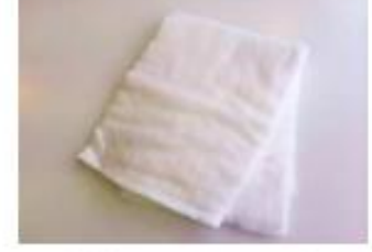
脱脂綿(カットされていないもの)

※このほかに、着物 袴 足袋 和装ストッキング ストッキング(フーツの場合) 髪飾り バッグ 和装用下着 補正用タオル2~3枚 着てきた服と靴を入れる袋 が必要となります