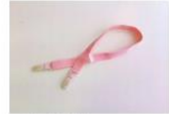
コーリンベルト(2本)