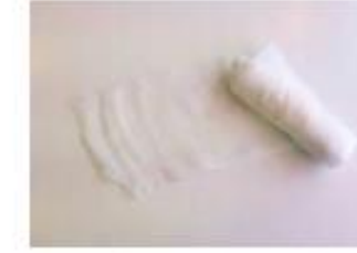
ガーゼ(5~10メートルのもの)