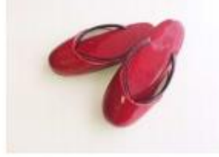
草履(屋内用、外履き用)